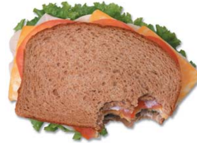
Makan dengan tetap

Bila ibu bapa terlalu mengawal paras glukos di dalam darah anaknya, glukos darah yang rendah atau hypoglycaemia akan menjadi risiko yang nyata. Kanak-kanak yang sangat aktif juga berkemungkinan mengalami hypoglycaemia. Jadi amatlah penting untuk ibu bapa memastikan yang anak mereka mempunyai satu rancangan pemakanan yang baik dan sentiasa mengawasinya. Ibu bapa juga perlu memastikan yang anaknya makan pada waktu yang sudah ditetapkan dan makan snek di antara waktu-waktu makan tersebut. Ajar mereka mengenal tanda-tanda dan